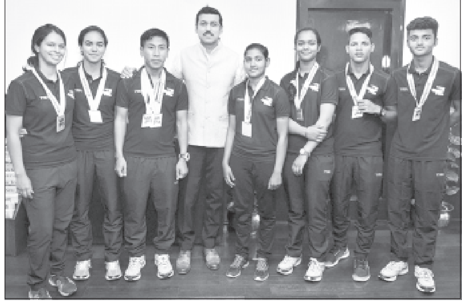
এক ফটো ছেছনত বিশ্ব যুৱ আৰ্চাৰী চেম্পিয়নশ্বিপত ভাৰতৰ বিজয়ী দলৰ সৈতে কেন্দ্ৰীয় ক্ৰীড়া মন্ত্ৰী ৰাজ্যবৰ্ধন সিং বাটোৱা, নতুন দিল্লীত

টি-২০ শৃংখলাৰ অন্তিম তথা তৃতীয়খন টি-২০ মেচত ভাৰতীয় দলটোৰ বাবে ট্ৰান্সপাৰ্ট হিচাপে পৰিগণিত হোৱাৰ সন্ধাননা আছে। তদুপৰি ভাৰতীয় বেটছমেনসকলে এদিনীয়া ক্ৰিকেট শৃংখলাত ভাৰতীয় দলটোৰ হৈ আকৰ্ষণীয় বলিং প্ৰদৰ্শন কৰা নাথান কুন্টাৰ নাইলৰ বিৰুদ্ধেও সতৰ্ক হৈ থকাটো অতিকৈ প্ৰয়োজন। অষ্ট্ৰেলিয়াৰ বিৰুদ্ধে পাঁচখনীয়া এদিনীয়া শৃংখলাখন ৪-১ ৰ ব্যৱধানত জয়লাভ কৰি ভাৰতে আই চি চি এ এদিনীয়া ক্ৰিকেট বেংকঙত শীৰ্ষস্থান দখল কৰিছে যদিও টি-২০ ত টিম ইণ্ডিয়াই পঞ্চম আৰু অষ্ট্ৰেলিয়াই ষষ্ঠ স্থানত আছে। কিন্তু সুদীৰ্ঘ