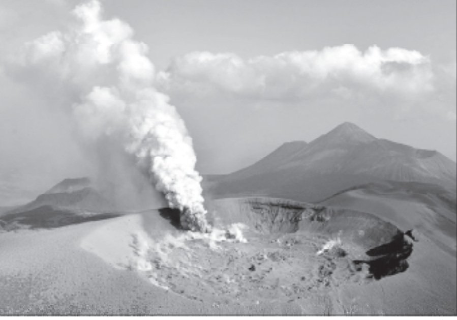
উত্তৰ-পশ্চিম জাপানৰ মিয়াজাকি-কাগোছিমা সীমান্তত থকা এটা আগ্নেয়গিৰি উদ্গিৰণ হোৱাৰ মুহূৰ্ত

মুম্বাই, ১২ অক্টোবৰঃ বৃহৎ মুম্বাই মহানগৰপালিকা, অৰ্থাৎ বি এম চিৰ ভান্দেপত অনুষ্ঠিত উপ-নিৰ্বাচনত বিজেপিৰ প্ৰাৰ্থীয়ে আজি শিৱসেনাৰ প্ৰাৰ্থীক ৪,৭৯২টা ভোটৰ ব্যৱধানত পৰাস্ত কৰিছে। ইয়াৰ লগে লগে মুম্বাই পৌৰ নিগমত দুয়োটা দলৰ প্ৰতিনিধিৰ সংখ্যাত ব্যৱধান আৰু হ্ৰাস পাইছে। এই সন্দৰ্ভত বি এম চিৰ এজন বিষয়াই জনাইছে যে বিজেপি প্ৰাৰ্থী