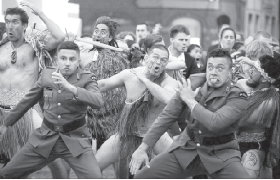
প্ৰথম বিশ্বযুদ্ধৰ স্মৰণৰ্থে বেলেজিয়াত অনুষ্ঠিত এক কাৰ্যসূচীত পৰম্পৰাগত 'হাকা নৃত্য' পৰিবেশন নিউজীলেণ্ডৰ একাংশ কলা-কুশলীৰ

কোনো বিকল্প নাই বুলি এজেণ্ডীয়ে জনাইছে। তদুপৰি প্ৰবল বানপানীৰ ফলত দেশখনৰ ১৭ হাজাৰ লোকক নিৰাপদ স্থানলৈ নিয়া হৈছে আৰু প্ৰায় দুই সহস্ৰাধিক অট্টালিকা সম্পূৰ্ণৰূপে বিধ্বস্ত হৈ পৰিছে। ইয়াৰ বাহিৰেও দুৰ্যোগকালীন বিভাগে আজি এই বিষয়ে সদৰী কৰি কৈছে যে দেশখনত অব্যাহত থকা প্ৰবল বৰষুণৰ বাবে ভূমিৰ কৃষিশাস্য নষ্ট হৈছে। উল্লেখ্য যে নিজৰ দীৰ্ঘদূৰত্বৰ উপকূল ৰেখাৰ বাবে ভিয়েটনামে প্ৰায়ে এনেধৰণৰ বিনাশকাৰী ধুমুহা আৰু বানপানীৰ সন্মুখীন হৈ আহিছে আৰু এনে এক ভয়াৱহ ধুমুহাত বিগত বৰ্ষত দুই শতাধিক লোক মৃত্যুমুখত পৰিছিল।